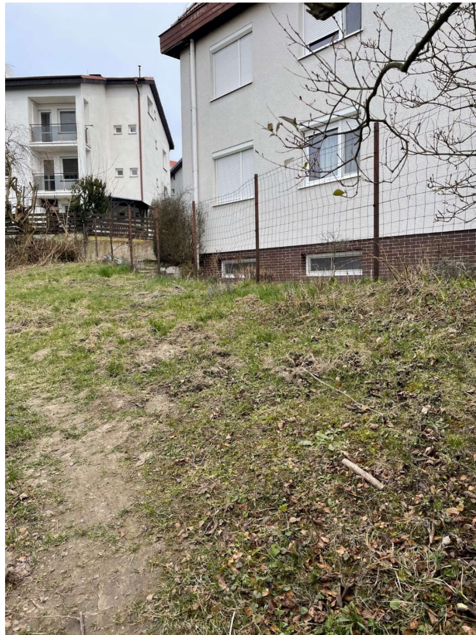
Obr.2 - Záujmový pozemok pre odpredaj-záhrada, fotografia – aktuálny stav