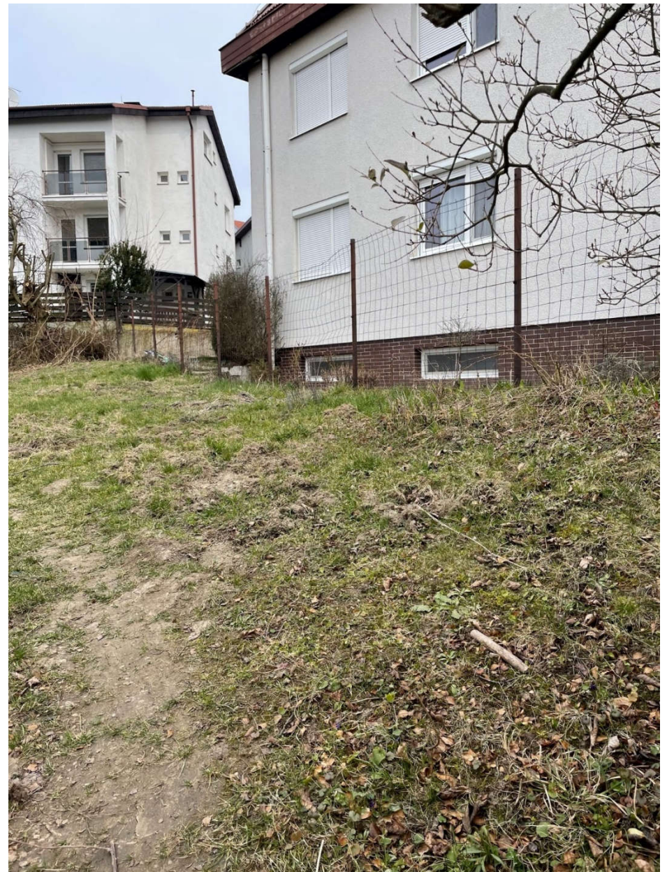
Obr.2 - Zaujmový pozemok do nájmu-záhrada, fotografia – aktuálny stav