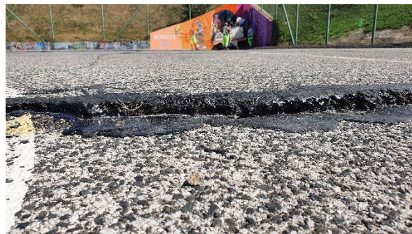
Stav po dokončení