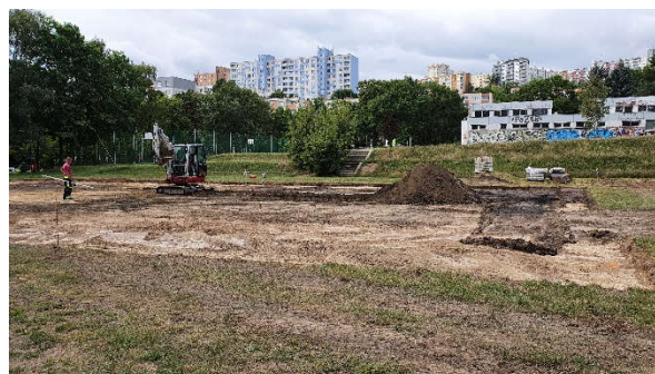
Stav po dokončení