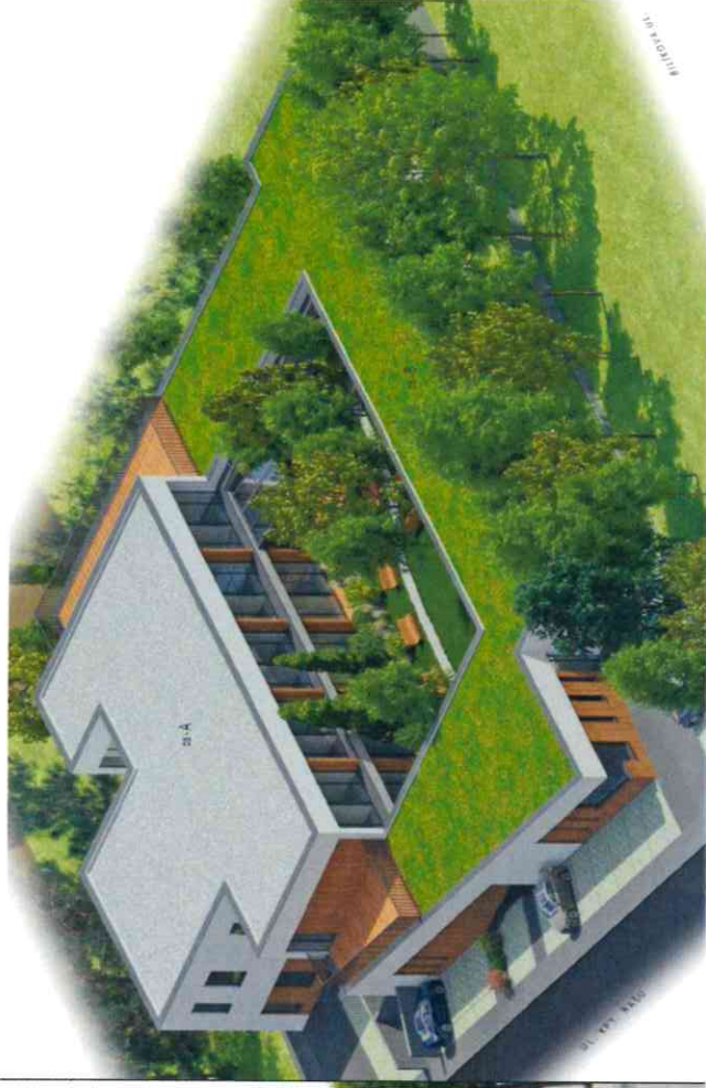
Pripravovaný Domov pre seniorov v Dúbravke (Kpt. J. Rašu)