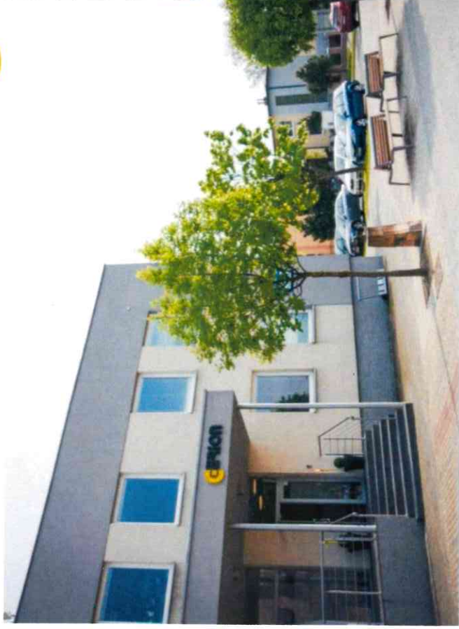
Domov pre seniorov v Záhorскеj Bystrici (Námestie Rodiny)