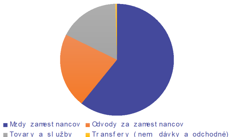
Prevádzkové náklady mestskej časti na MŠ L. Sáru č.3 v roku 2018

V tabuľke sú uvedené bežné výdavky na prevádzku materskej školy, vrátane školskej jedálne, ktorá je súčasťou materskej školy.